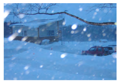
外は猛吹雪でした。 オツカレサマ。