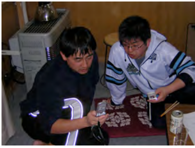
話し合いが終わり、和やかなひととき。