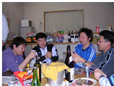
アドレス交換をする者、ゲームを楽しむ者、密会(?)する者…。