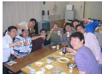
話し合いの前にすでに乾杯!?