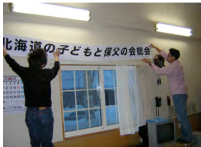
総会らしくなってきました。