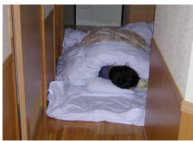
酔いつぶれた亙会長は廊下でおやすみ…。