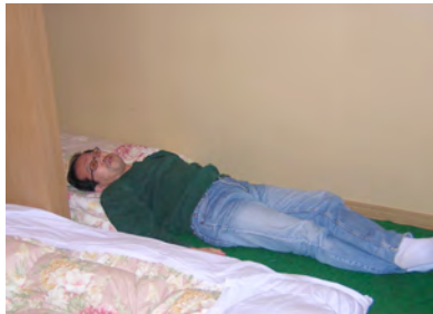
疲れた船山さんは押し入れて、