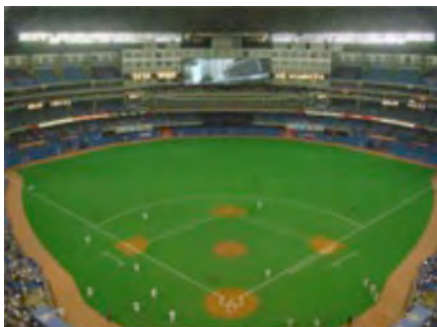
MLBボールパークシリーズ No.11 スカイドーム トロントブルージェイズ

来年度は、それぞれが、きちんと言葉で伝え合うことを目標にやっていきたいと思ひます。個人としても人のせいばかりにしないで、まずは自分が他の人に考えていることを解りやすく伝えること。更に、子どもの中にもっと入っていき、一緒に遊ぶ中で、普段の遊び自体を盛り上げ、そこから、行事へとつなげていく事なんかを大切にやって生きたいと思ひます。