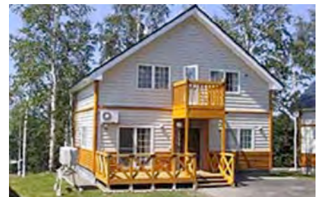
こんな素敵なコテージです！

08:00 起床 起きられるかな？ 09:00 朝食 食べられるかな？ 11:00 チェックアウト 無事に帰りましょう