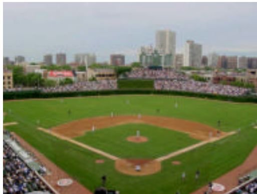
MLBボールパークシリーズNo2 リグレーフィールド(シカゴカブス)

楽しみといえば……。私の園では、砂場が大盛り上がり!!! 色々な店がオープンするのは、毎年のことですが、今年は、それよりも‘光る泥だんごづくり’に保育者も子どもたちも真剣に取り組んでいます。水を含ませた砂で、まず、だんごをつくり、そこへ乾いた砂をまぶしてにぎり、また、まぶして、またにぎり……。を繰り返した後、乾いた布で磨きこんでいきます。すると、少しずつですが表面が光り始めます。最終的には顔が映る位ピカピカに光るらしいのですが、まだそこまでは、ないようです。みんなそれぞれビニール袋に入れて保存して、また次の日セッセと磨きこんでいます。どこまで光るか楽しみです。 みなさんの園でもいかがですか? うまくすれば15年位もつのもできるそうですよ……。