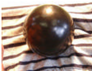
これが泥だんごだよ!