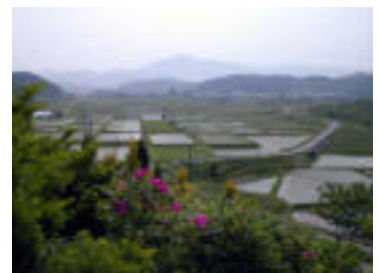
遠野ってこんなところ・・・