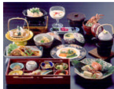
こーんなごちそうは?